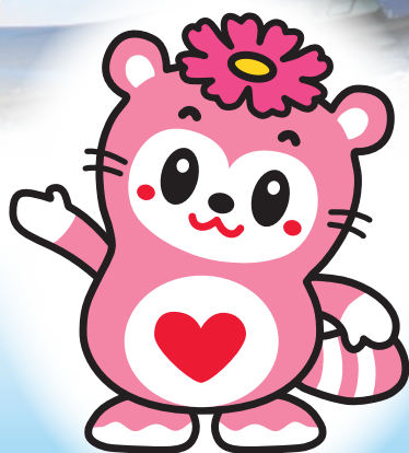
さぬき市社会福祉協議会 イメージキャラクター ふっきーちゃん