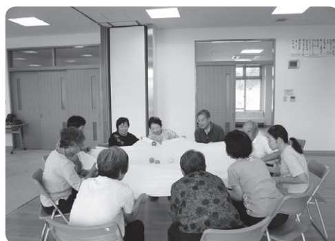
いきいき健康教室(寒川プラザ)