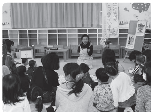
赤ちゃんのお話会